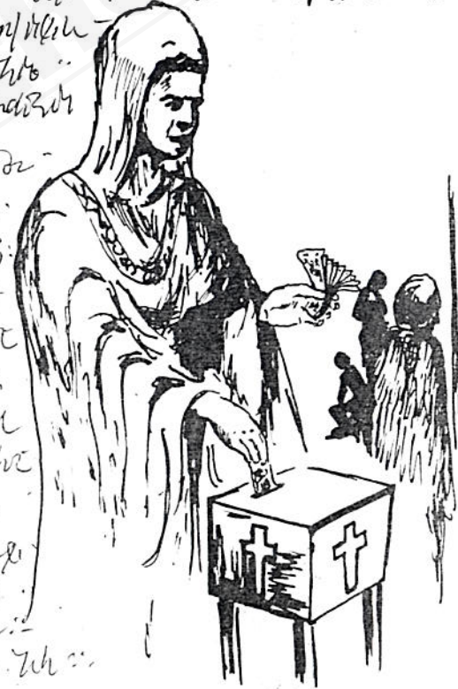
እምላክ ሆይ በሰማይና በምድር ያለው ሁሉ የእንተ ነው ባለጠግነትና ክብር ከእንተ ዘንድ ነው ሁሉ ከእንተ ዘንድ ነው። .... ከእጅህም የተቀበልነውን ሰጥተንልል። (1 ዜና 29:11)

- ከመካኒኒት ገንዘብ - ስጦታ - ማህበራት ፡ መታሰቢያ ሰነድ ጽሑፍ - ጽሑፍ - ጽሑፍ ዘመን ጽሑፍ - ከሰው ጽሑፍ ጽሑፍ ጽሑፍ ጽሑፍ ጽሑፍ ጽሑፍ ጽሑፍ ጽሑፍ ጽሑፍ ጽሑፍ