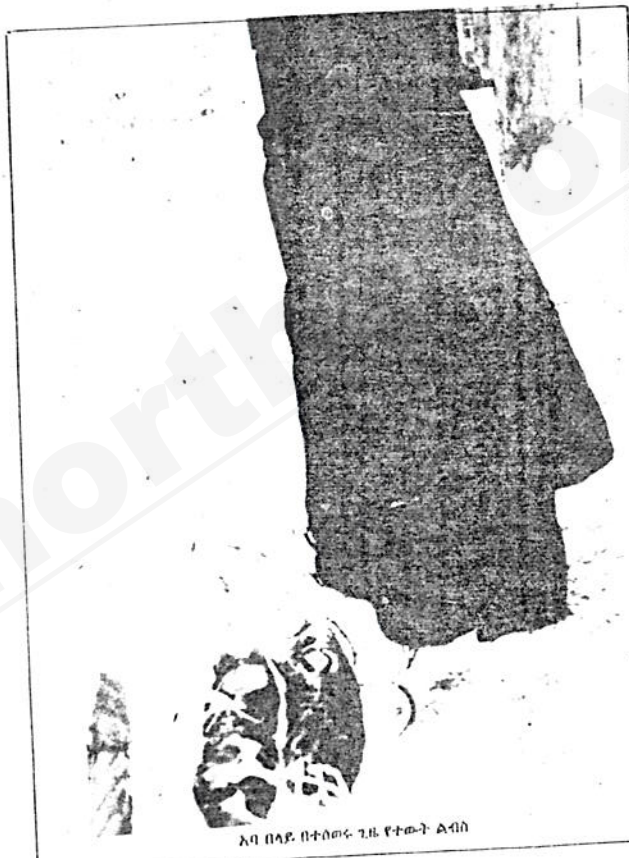
አባ በላይ በተሰጠው ጊዜ የተወጡ ልብስ