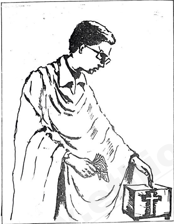
እቤቱ እምላካችን ሆይ ለቅዱስ ስም በቶ እንሠራ ዘንድ ይህ ያዘጋጀነው ባለጠግነት ሁሉ ከእጅህ የመጣ ነው። ሁሉም የእንተ ነው።

- ከመካኒኒት ገንዘብ - ስጦታ - ማህበራት ፡ መታሰቢያ ሰነድ ጽሑፍ - ጽሑፍ - ጽሑፍ ዘመን ጽሑፍ - ከሰው ጽሑፍ ጽሑፍ ጽሑፍ ጽሑፍ ጽሑፍ ጽሑፍ ጽሑፍ ጽሑፍ ጽሑፍ ጽሑፍ